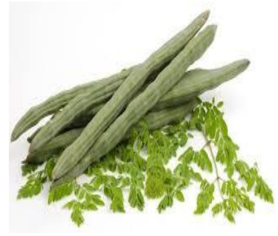
Moringa oleifera Moringa Hypertension Paludisme Constipation