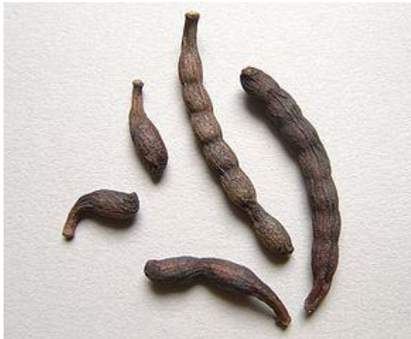
Xylopia aethiopica Poivre long, Sindian "Plaie de ventre" Hémorroïdes