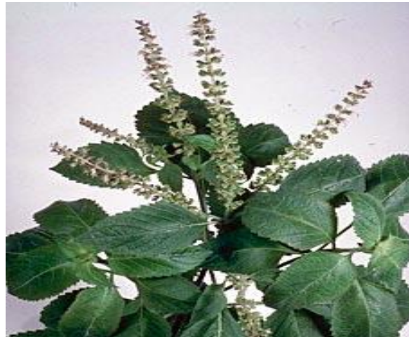
Ocimum gratissimum Aromagninrin "Plaie de ventre" Paludisme